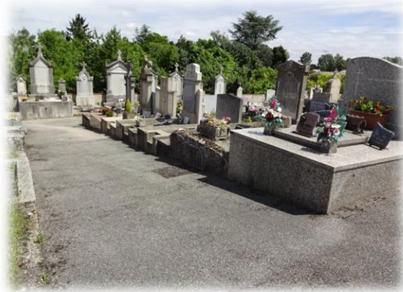
Commune de ST SORLIN EN VALLOIRE