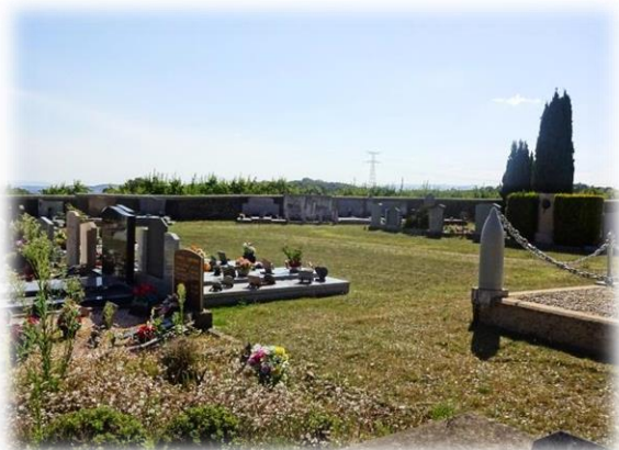
Commune de BREN

Invitation ouverte à tout élu, agent technique ou habitant intéressé